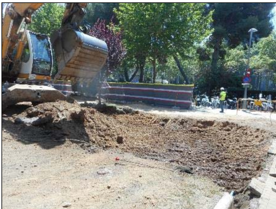
11. Tasques de rebaix a l'angle oest de l'àmbit d'actuació.