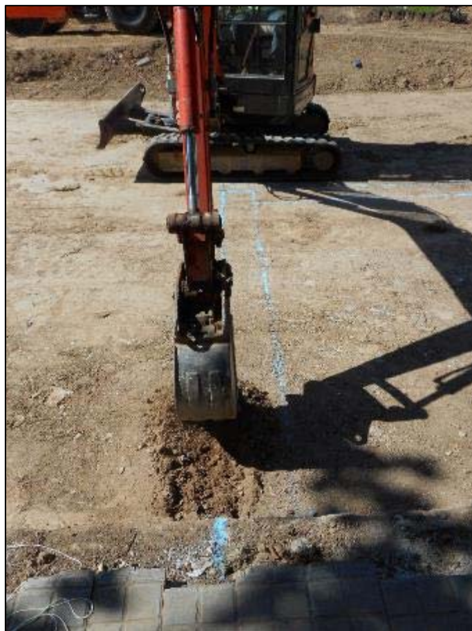
18. Inici de l'obertura de les rases perimetrals pertnynets al parterre nº2.