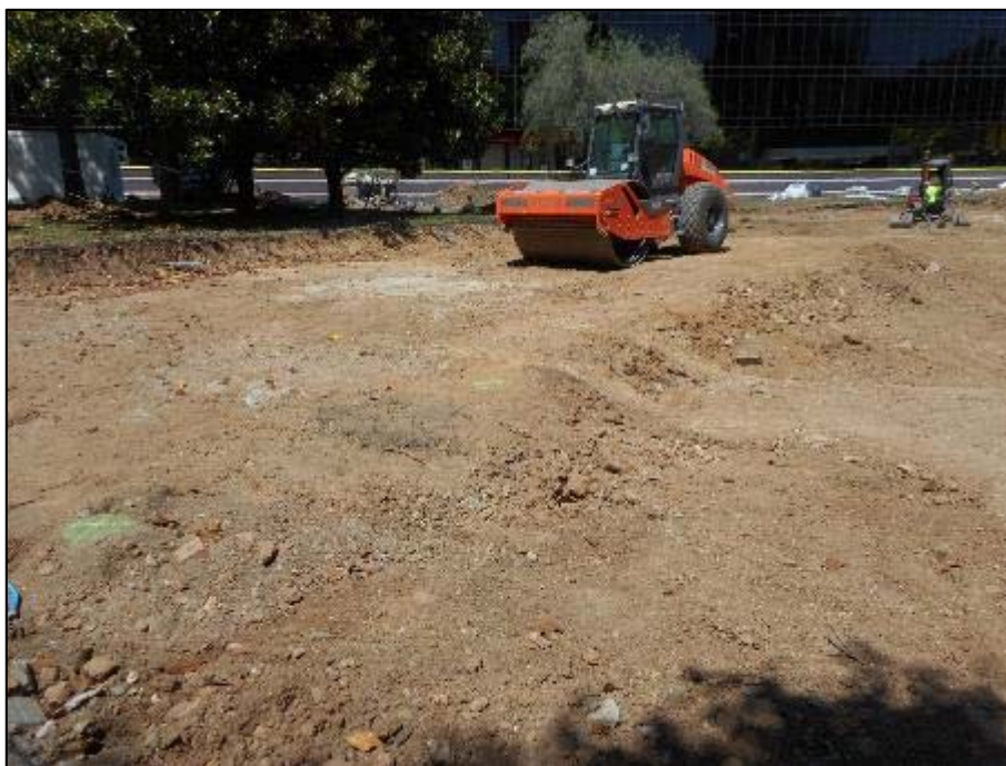
15. Tasques de compactació del terreny un cop assolida la cota màxima dels rebaixos.