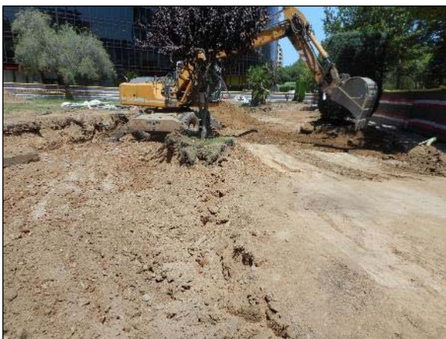
12. Tasques de rebaix a l'angle oest de l'àmbit d'actuació.