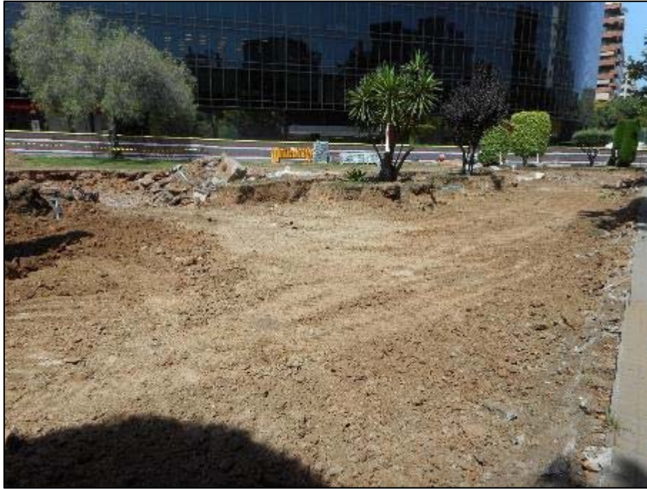
13. Àmbit d'actuació un cop assolida la cota requerida pels rebaixos.