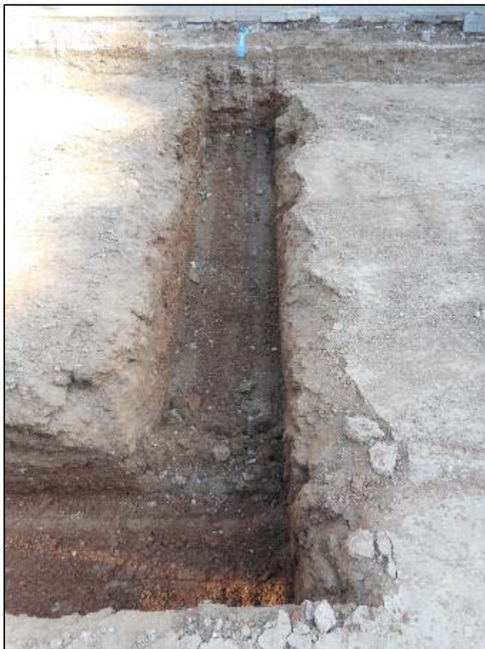
19. Vista de les rases perimetrals un cop assolida la cota requerida per a les mateixes.