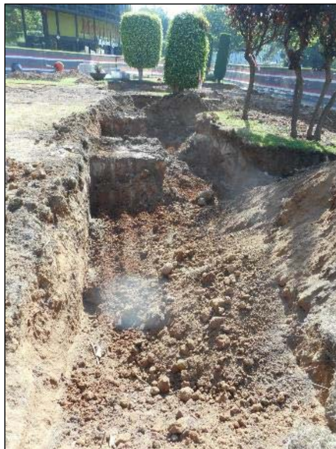
8. Vista de l'àmbit d'actuació amb la presència de diferents fonaments de formigó pertanyents a serveis de reg i manteniment de la bassa anterior.