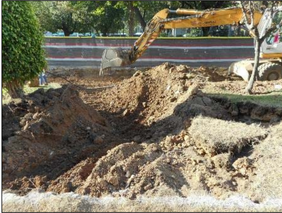
7. Màquina realitzant els rebaixos dins l'àmbit d'actuació.