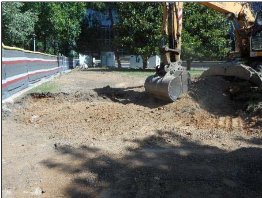
4. Màquina realitzant els rebaixos dins l'àmbit d'actuació.