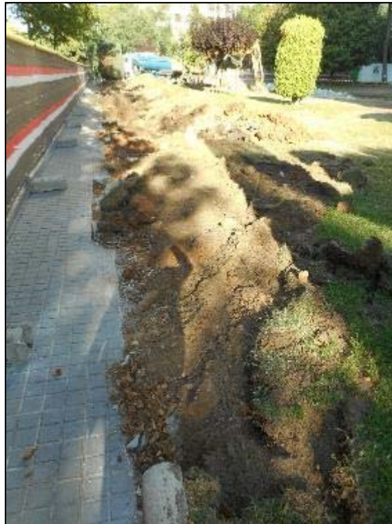
2. Inici de les tasques de rabix de terres a l'àmbit d'actuació.