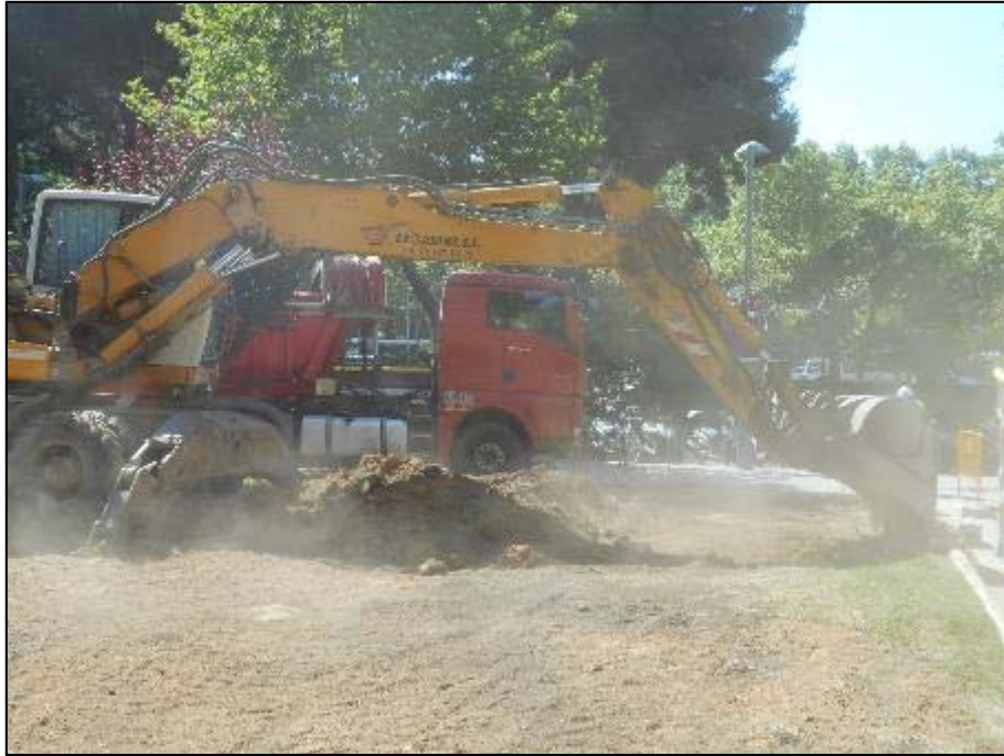
3. Inici de les tasques de rabix de terres a l'àmbit d'actuació.