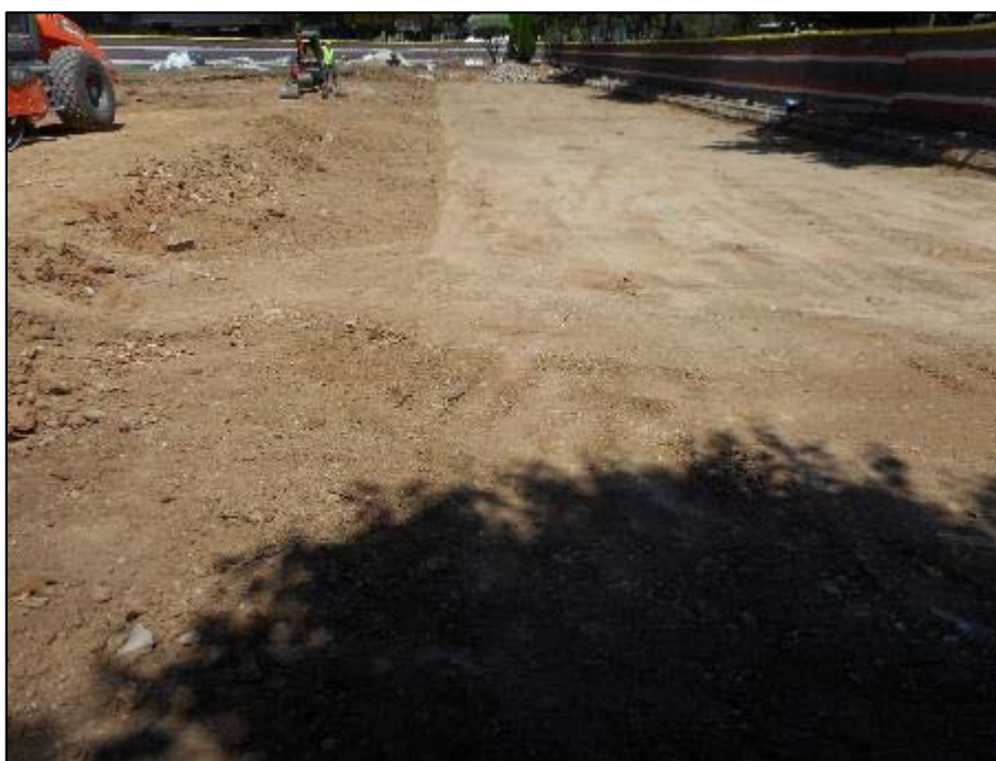
16. Àmbit d'actuació un cop assolida la cota requerida pels rebaixos, compactació del terreny.