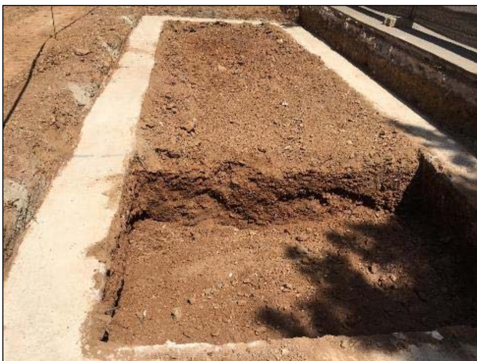
22. Buidat intern del parterre 2.