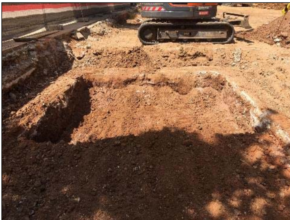
21. Buidat intern del parterre 2.