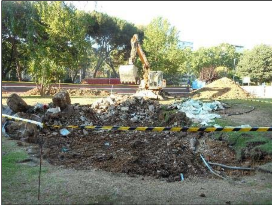
1. Extracció de la bassa.