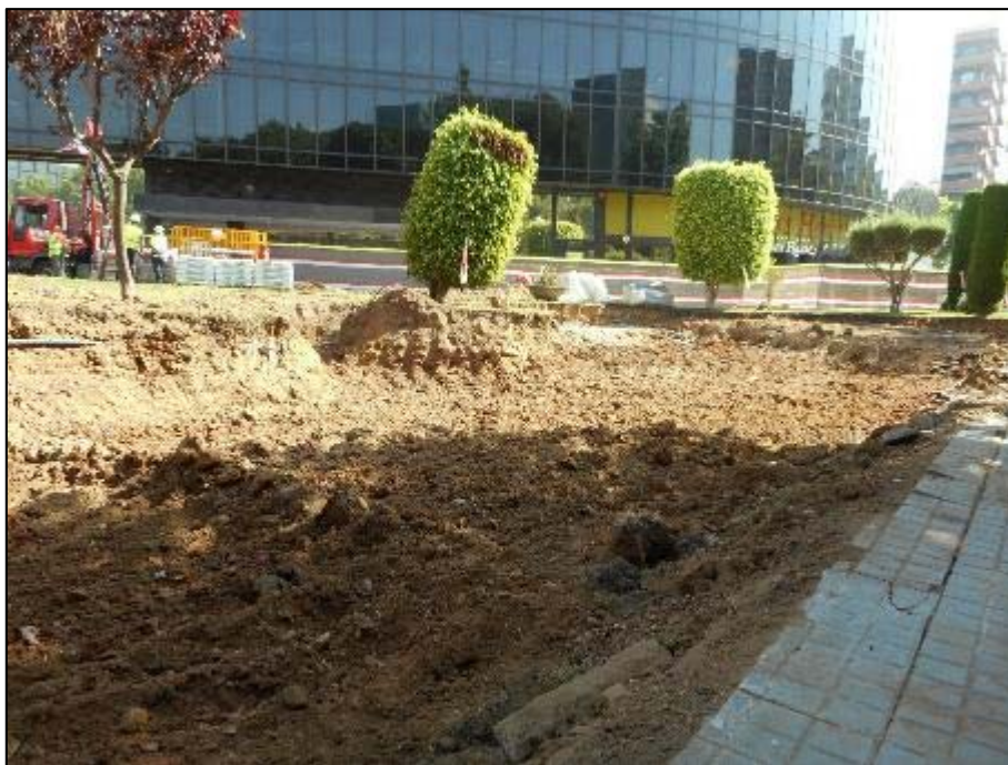
10. Àmbit d'actuació un cop assolida la cota, orientació nord-est.