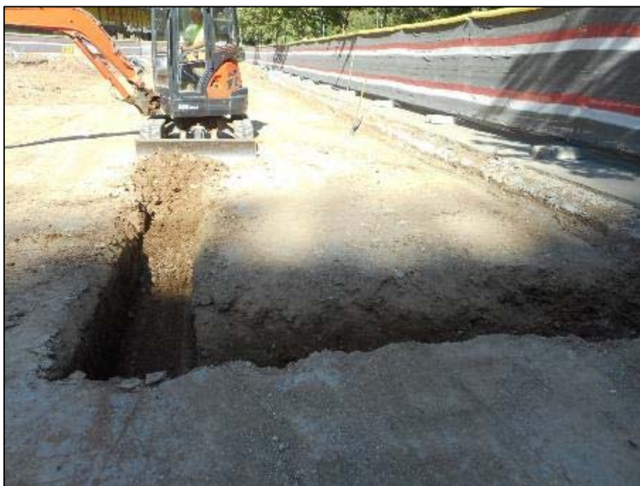
20. Màquina realitzant rases perimetrals dels parterres.