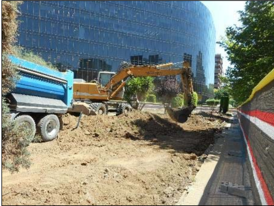
5. Màquina realitzant els rebaixos dins l'àmbit d'actuació.