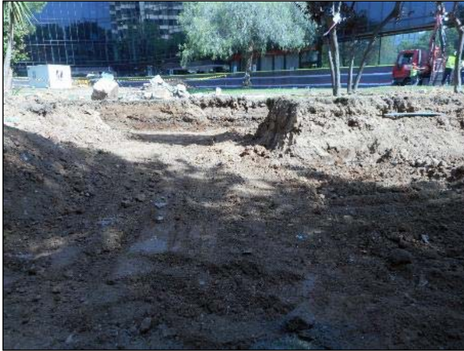
9. Vista nord de l'àmbit d'actuació.