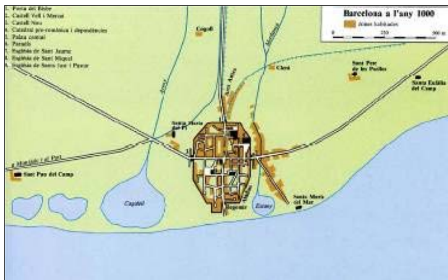
Barcelona a l'any 1000, segons Philip Banks (Catalunya Romànica Vol. XX)

Memòria de la intervenció arqueològica a l'Avinguda Diagonal 652-656 (Les Corts - Barcelona) Codi 070/19. Juliol'19.