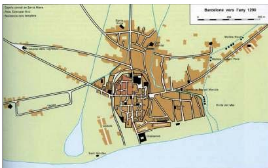
Barcelona a l'any 1200 segons Philip Banks (Catalunya Romànica Vol. XX)

A principis del s. XII la gran expansió demogràfica provocà la creació i creixement d'aquests nuclis poblacionals i de molts obradors al voltant de les muralles, aquest creixement de la ciutat fora de l'antic recinte murari romà serà el responsable de la construcció d'un nou sistema defensiu. Les dades més antigues sobre el començament de les obres d'aquesta nova estructura defensiva fan referència a 1285, però les darreres investigacions i actuacions arqueològiques no han pogut localitzar fins al moment evidències materials ni estructurals per a aquesta cronologia.