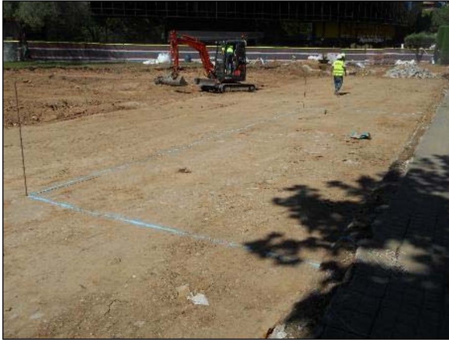
17. Plantejament de les rases perimetrals destinades als paretres 1-5.