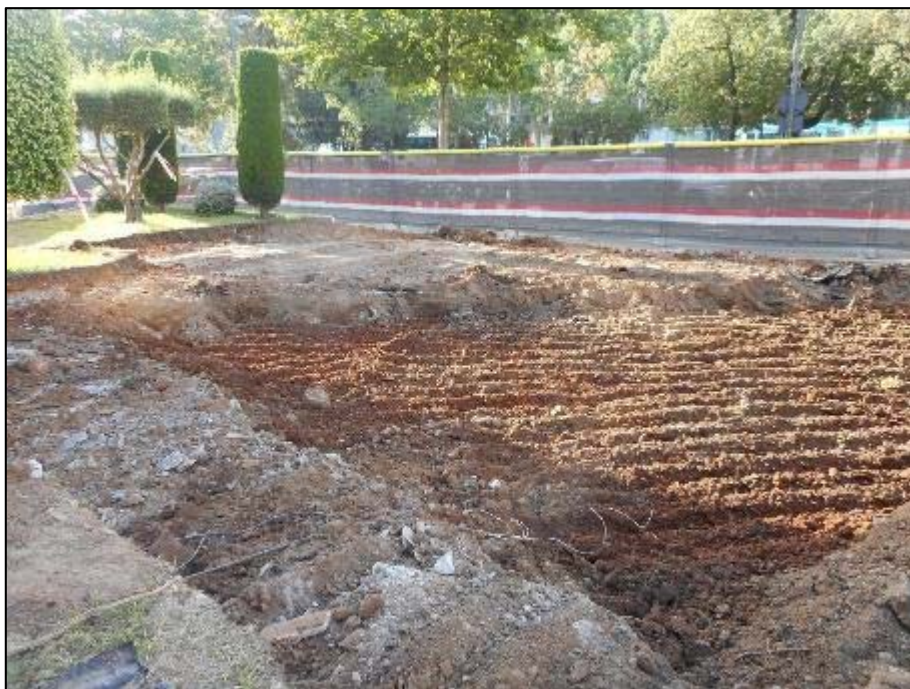
6. Vista de l'àmbit d'actuació rebaixat a la cota requerida, orientació nord-est.